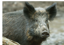
Das Wildschwein vom Seerücken - das Maskottchen des Forum B